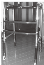
▲折りたたみ式 歩行器

また、福祉用具を必要とされている方も、お気軽にご連絡くだ さい。シルバーカー、車イスは希望されている方がいらっしやい ます。