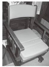
▲ポータブルトイレ (家具調)