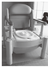
▲ポータブルトイレ (暖房便座)