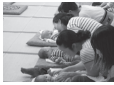
▲赤ちゃんもママもリラックス

※予防接種後24時間はベビーマッサージを受けられません。また、オイルを使用します。アレルギーのある場合は当日講師にご相談ください。