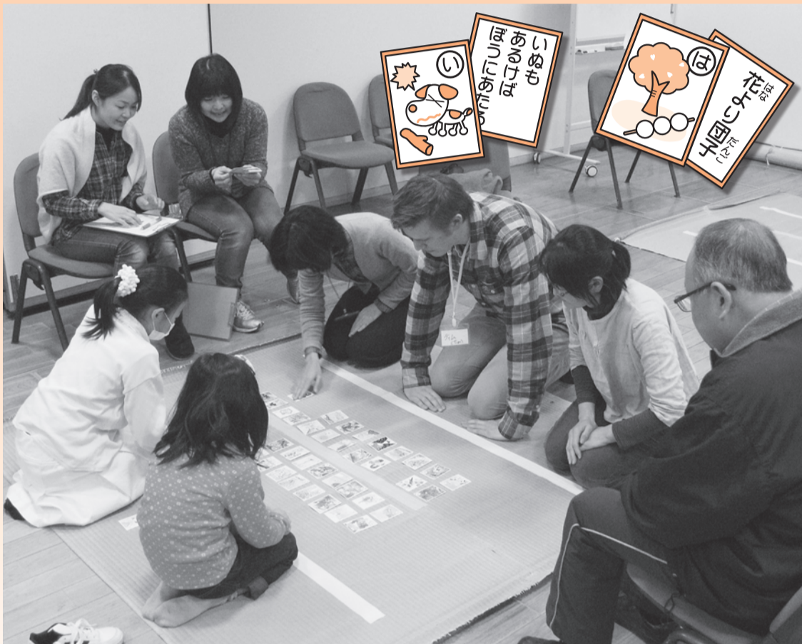
▲前回、開催した大会『競技かるたで真剣勝負』三世代でも楽しみました

当日は、阪神淡路大震災から20年目。 くにたちカルタで地域を知りながら、 紙食器を作って非常食体験もします (100食限定)。この機会にぜひ!