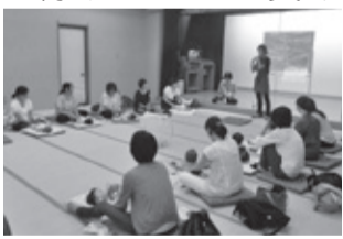
↑子育て支援ひろば「かるがも」

市民参加の運営による子育てひろばです。2歳未満までのお子さんとその保護者同士の仲間づくりやベビーマッサージなどを取り入れています。ご利用には一般世帯会員以上のご加入をお願いします。「かるがも」開催は毎月第2火曜日(1月を除く)。また毎年10月はかるがもの周年記念イベント、12月はクリスマスイベントとなり、事前申込制になりますのでご注意ください。