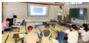
前回の講座の様子